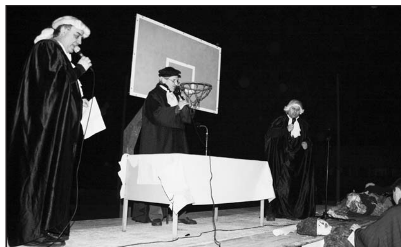
Borgosotto: le fasi del "processo" per giudicare i pupazzi di Carnevale.