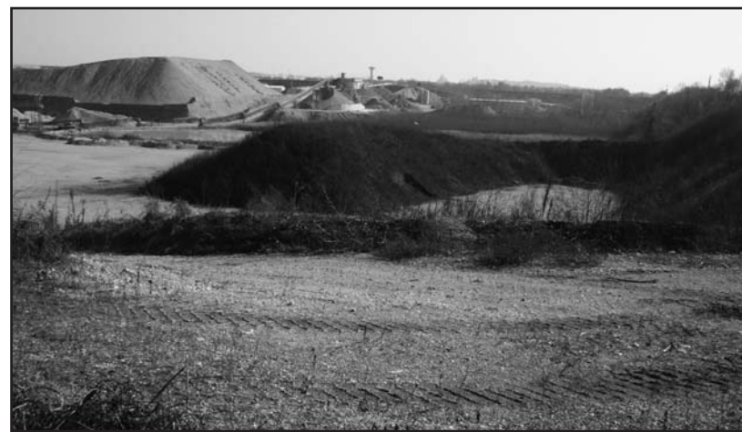
L'altra faccia della medaglia a Montichiari. Vicino alle discariche si scava in acqua.