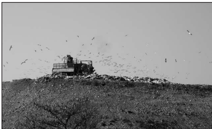
Un profilo che avanza inesorabilmente.

Si parla tanto dell'apertura ai giovani, questa è una occasione storica per una loro partecipazione alle scelte della gestione del territorio e del loro futuro.