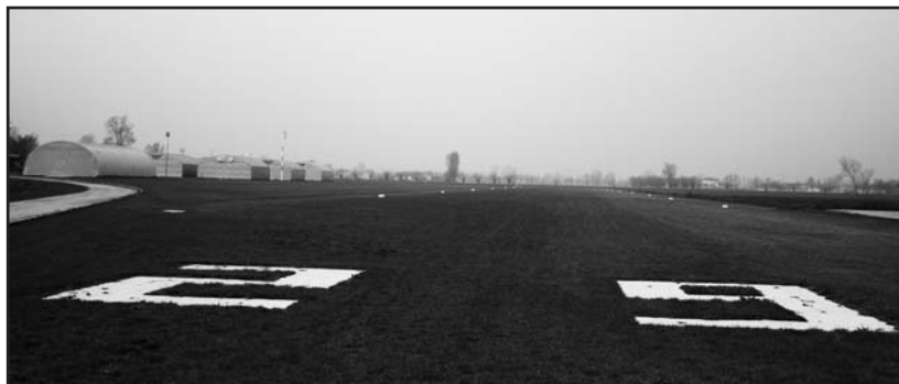
La pista con a sinistra gli hangar.