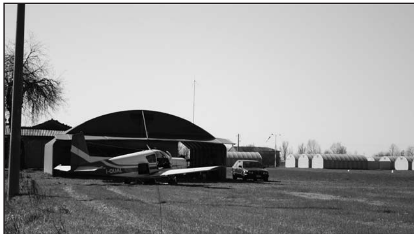
Preparativi prima del volo.

Ben tredici hangar con rispettivi "aerei da turismo", una casetta in legno per i servizi, ed una pista di circa trecento metri ricavata in un campo, attrezzato per l'uso.