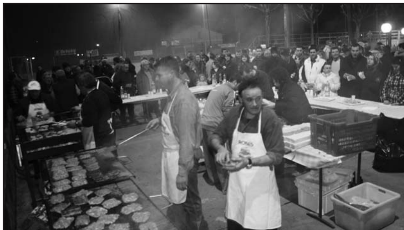
A S. Giustina: l'attesa del panino.