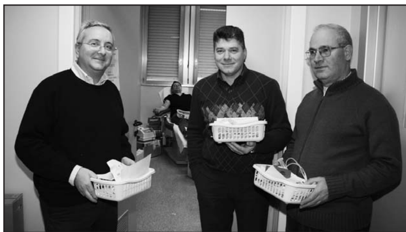
Avisini in attesa della donazione.

Come ha ribadito il Direttore sanitario, durante l'assemblea annuale, il sangue non si può riprodurre artificialmente, l'unica fonte è il donatore. Auspicare quota