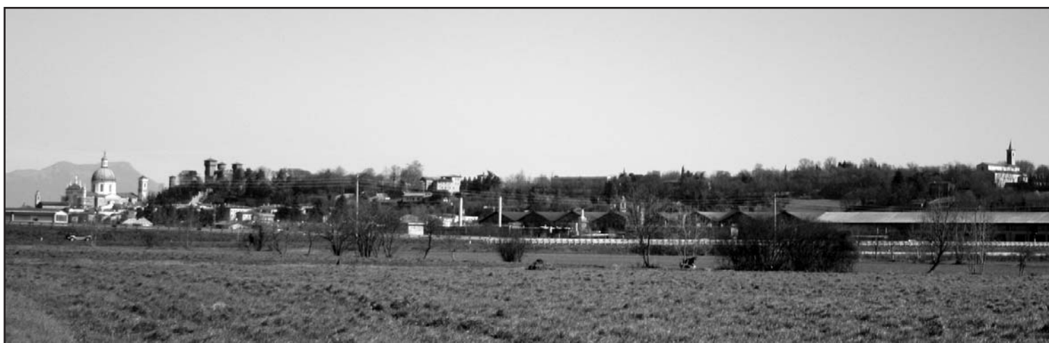
Il profilo di Montichiari che molti ci invidiano.

In tal senso la Provincia crede nella concertazione