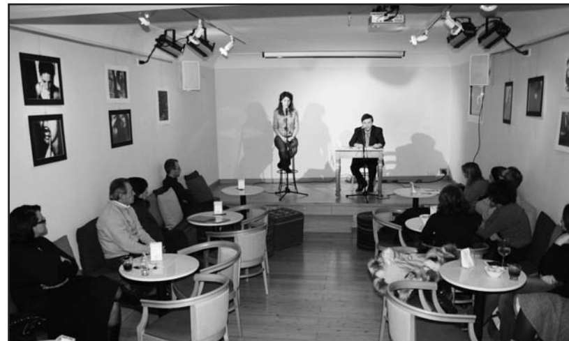
La saletta dove si svolgono i vari appuntamenti.