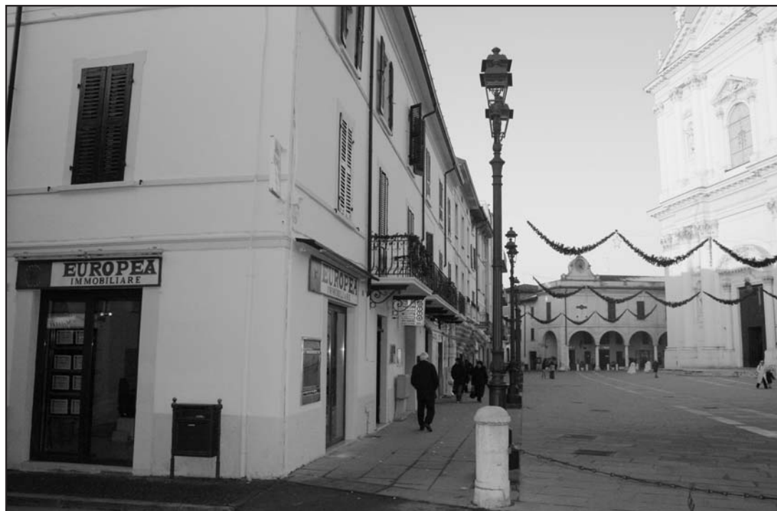
La Sede in Piazza S. Maria 1 - 25018 Montichiari (BS)